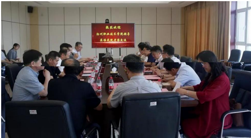
企 养 交